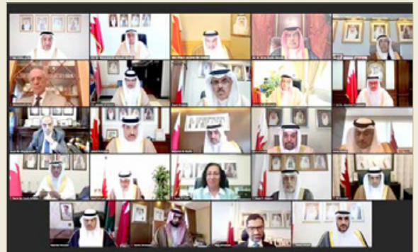
سمو ولي العهد رئيس مجلس الوزراء يترأس الاجتماع الاعتيادي لمجلس الوزراء

مذكرة وزير المواصلات والاتصالات بشأن اتفاقية الخدمات الجوية بين مملكة البحرين وجمهورية البوسنة والهرسك، والسياحة بشأن أهم مؤشرات الربع الأول من العام 2021.