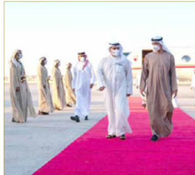
سمو ولي العهد رئيس مجلس الوزراء يصل دولة الإمارات العربية المتحدة الشقيقة

وجهود البلدين ومسارات التعاون بينهما ضمن الإطار الثنائي والدولي في مواجهة التحديات والتعامل مع التطورات.