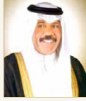
أمير دولة الكويت