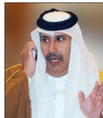
حمد بن جاسم