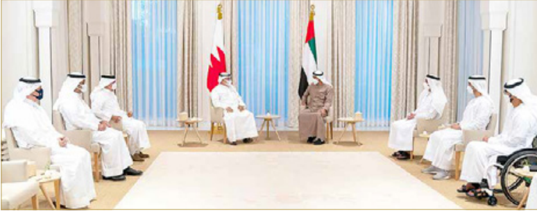
سمو ولي العهد رئيس مجلس الوزراء لدى لقائه سمو ولي عهد أبوظبي نائب القائد الأعلى للقوات المسلحة

جاء ذلك لدى لقاء سموه أمس مع ولي عهد أبوظبي نائب القائد الأعلى للقوات المسلحة بدولة الإمارات العربية المتحدة الشقيقة صاحب السمو الشيخ محمد بن زايد آل نهيان، بحضور سموه بضمير الشاطي وزير الداخلية الفريق سمو الشيخ سيف بن زايد آل نهيان وسمو الشيخ حمدان بن محمد بن زايد آل نهيان والشيخ زايد بن حمدان بن زايد آل نهيان ورئيس مجلس إدارة مطارات أبوظبي الشيخ محمد بن حمد بن طحسون آل نهيان وعدد من أصحاب السمو والمعالى والسعادة المسؤولين بدولة الإمارات العربية المتحدة، ووزير الداخلية الفريق أول ركن الشيخ راشد بن عبدالله آل خليفة، ووزير المالية والاقتصاد الوطني الشيخ سلمان بن خليفة آل خليفة وسفير مملكة البحرين لدى دولة الإمارات العربية المتحدة الشقيقة الشيخ خالد بن عبدالله بن علي آل خليفة، في إطار الزيارة الأخوية التي يقوم بها سموه إلى أبوظبي، حيث تقل صاحب السمو الملكي ولي العهد رئيس مجلس الوزراء تحيات جلالته الملك إلى صاحب السمو رئيس دولة الإمارات العربية المتحدة وصاحب السمو ولي عهد أبوظبي نائب القائد الأعلى للقوات المسلحة، وتمنيات جلالته لدولة الإمارات العربية