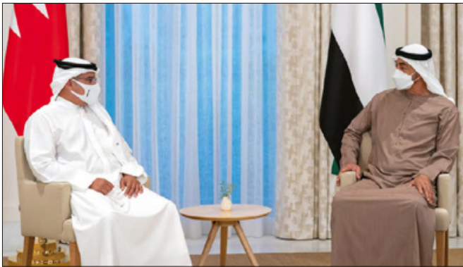
سمو ولي العهد رئيس الوزراء خلال اجتماعه مع ولي عهد أبوظبي

استعراض التطورات الإقليمية والدولية ومواجهة التحديات