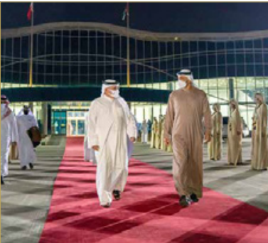
سمو ولي العهد رئيس مجلس الوزراء يغادر دولة الإمارات العربية المتحدة الشقيقة

وكان في مقدمة مستقبلي صاحب السمو الملكي ولي العهد رئيس مجلس الوزراء، صاحب السمو ولي عهد أبوظبي نائب القائد الأعلى للقوات المسلحة بدولة الإمارات العربية المتحدة، ونائب رئيس مجلس الوزراء وزير الداخلية بدولة الإمارات العربية المتحدة وعدد من كبار المسؤولين بدولة الإمارات العربية المتحدة وسفير مملكة البحرين لدى دولة الإمارات العربية المتحدة الشقيقة الشيخ خالد بن عبدالله بن علي آل خليفة.